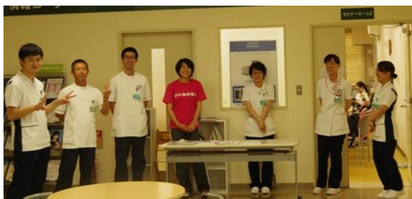
リハビリスタッフでお出迎え